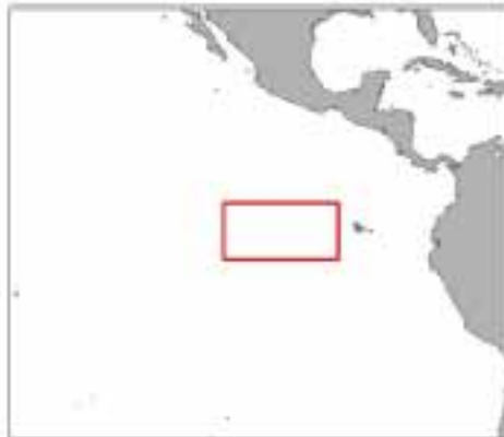
Figura 1. Área de veda]